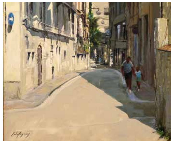
Premi d'honor 2018 Narcís Sala Gascons